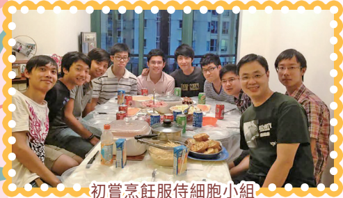
初嘗烹飪服侍細胞小組

後來，我轉而在GLOW團契服侍高中和大專生，繼續以愛筵款待年輕人。某個暑假，丈夫在家中舉辦了一個星期兩晚的查經班。那段日子對我來說是極大的挑戰：我需要在午飯時間買餸，晚上放工後便馬上趕回家煮飯。在那個與時間競賽的過程中，訓練出了高效的時間管理和預備食材的能力。奇妙的是，我非但沒有感到巨大壓力，反而漸漸愛上了烹飪，更意外發現了自己在款待及烹飪方面的恩賜。時至今日，GLOW HomeGroup每月一次仍然在我家開組聚餐，成為我們團契生活不可或缺的一部分。