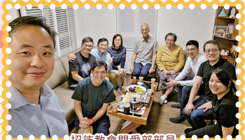
招待教會關愛部部員