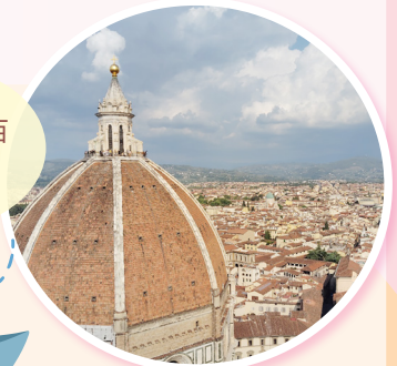
翡冷翠聖母百花大教堂

求聖靈的光照，照亮我們的心，令我們成為活生生的教堂，願天父永永遠遠居住在裏面。阿們！✝