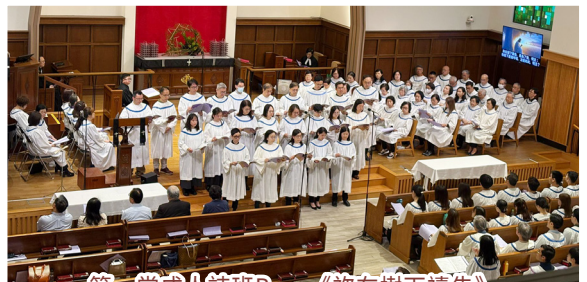
第一堂成人詩班B — 《祢在樹下禱告》