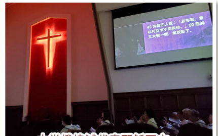
大堂燈熄滅代表耶穌死亡。

聖樂崇拜第二部分是聖餐禮。雖然每個月第二主日我們都有聖餐禮，但在受苦節當天信徒一起同領聖餐，實在別具意義！哥林多前書11章23-26節記載：我當日傳給你們的是從主所領受的。主耶穌被出賣的那一夜，拿起餅來，祝謝了，就擘開，說：「這是我的身體，為你們捨的；你們要如此行，為的是記念我。」飯後，他也照樣拿起杯來，說：「這杯是用我的血所立的新約；你們每逢喝的時候，要如此行，來記念我。」你們每逢吃這餅，喝這杯，是宣告主的死，直到他來。✠