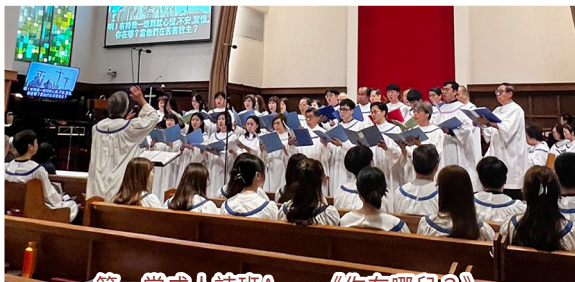
第一堂成人詩班A — 《你在哪兒?》