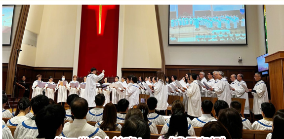
第二堂成人詩班A — 《我靈奮起》