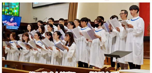
第二堂成人詩班B — 《流淚之王》